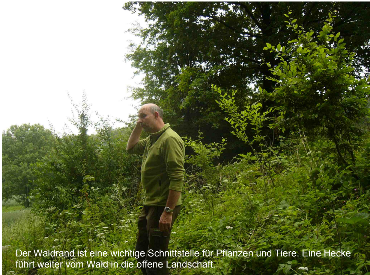
Der Waldrand ist eine wichtige Schnittstelle für Pflanzen und Tiere. Eine Hecke führt weiter vom Wald in die offene Landschaft.