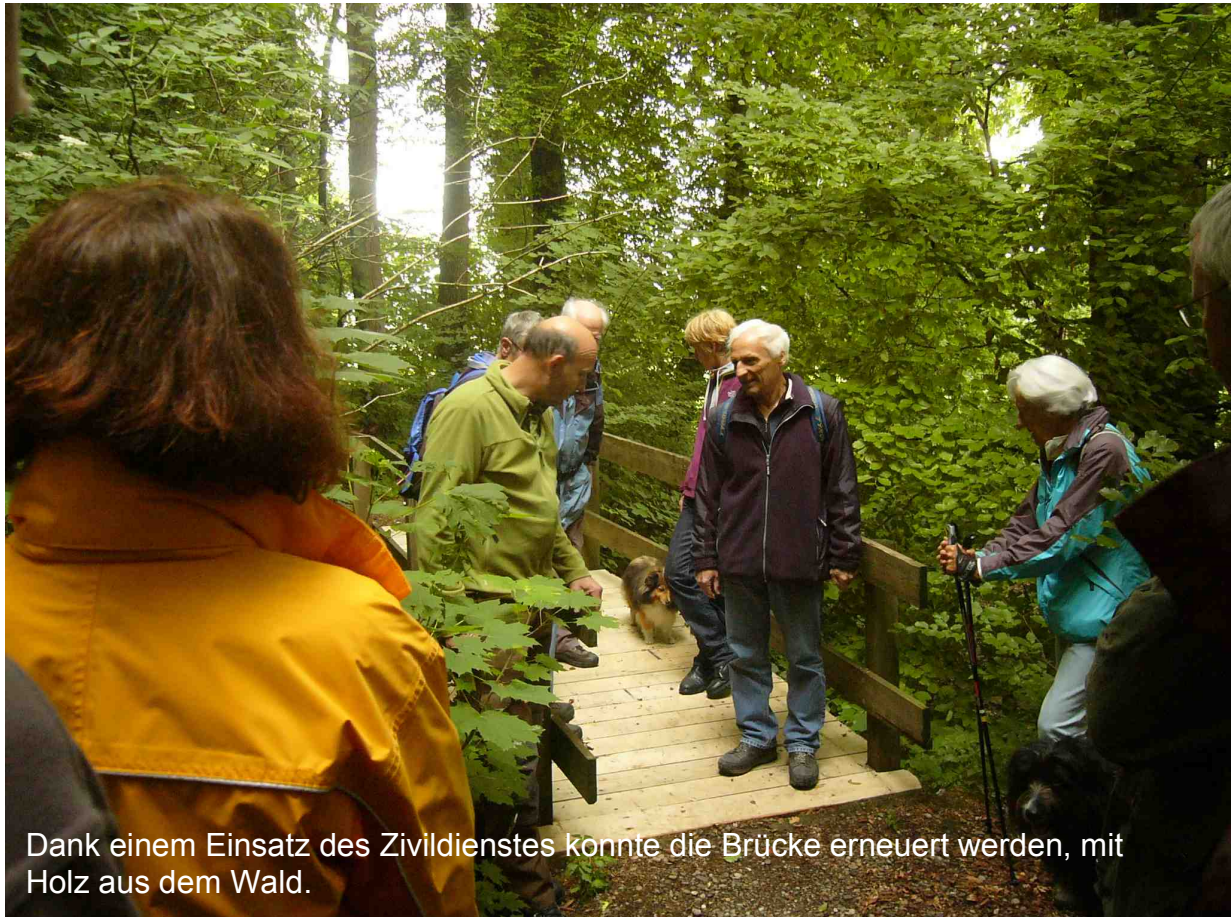
Dank einem Einsatz des Zivildienstes konnte die Brücke erneuert werden, mit Holz aus dem Wald.