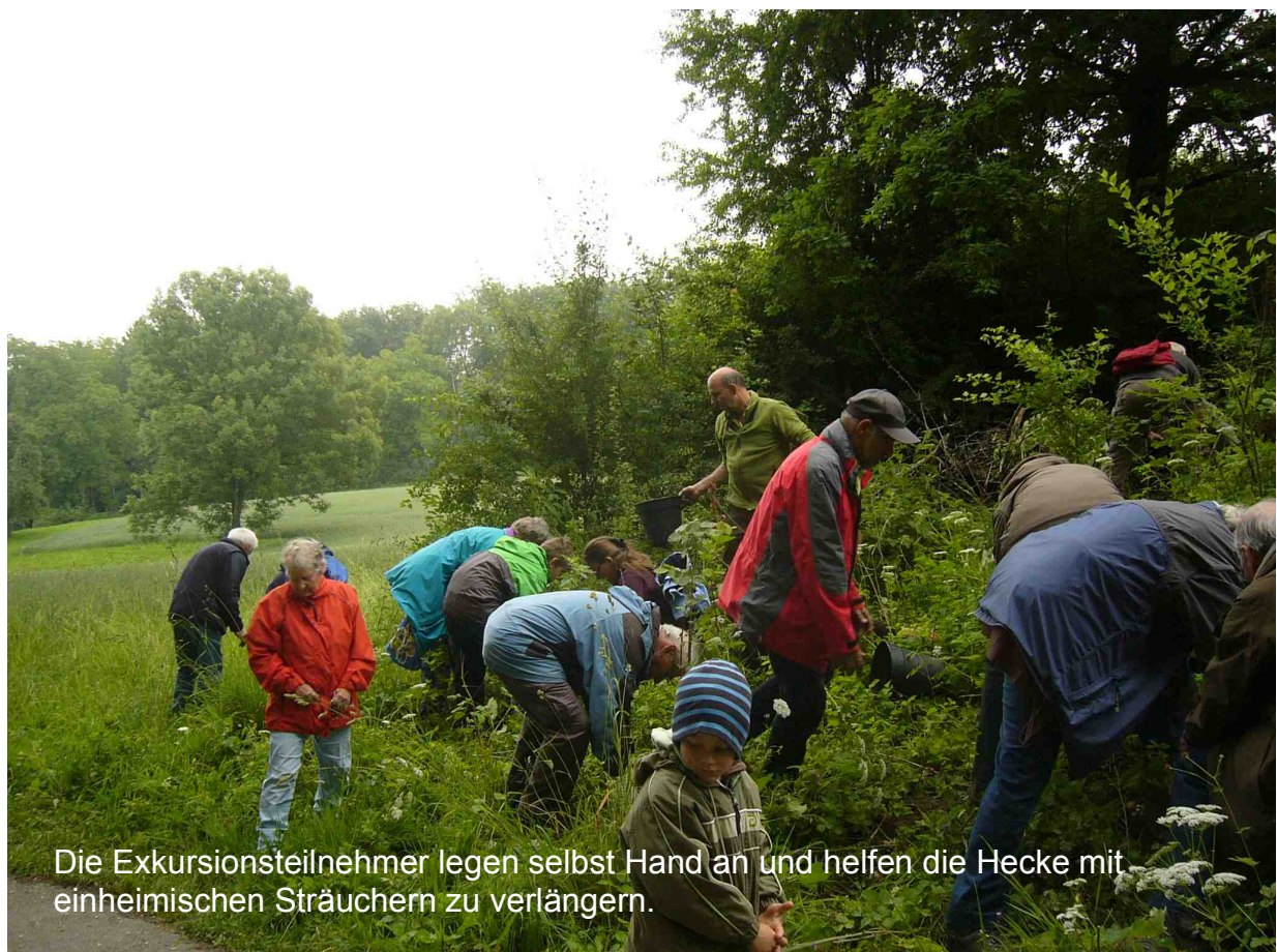
Die Exkursionsteilnehmer legen selbst Hand an und helfen die Hecke mit einheimischen Sträuchern zu verlängern.